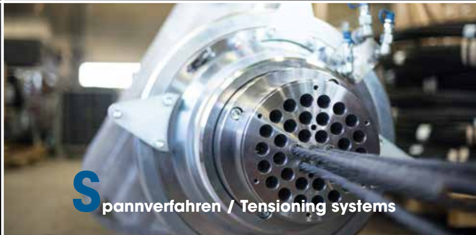
S pannverfahren / Tensioning systems