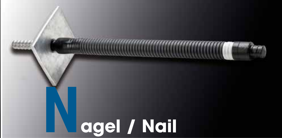
N agel / Nail