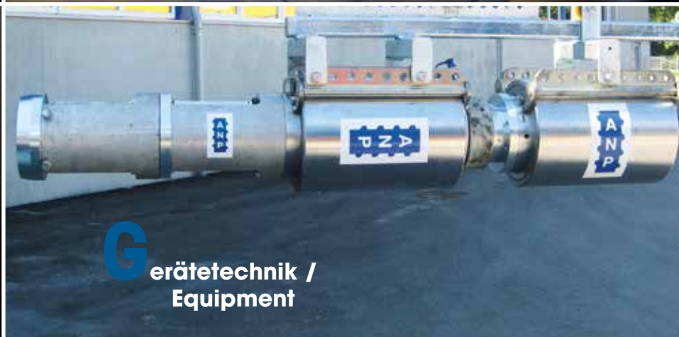
G erätetechnik / Equipment