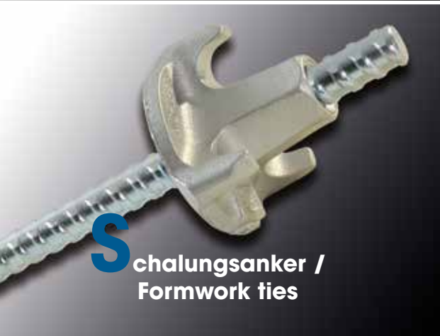
S chalungsanker / Formwork ties