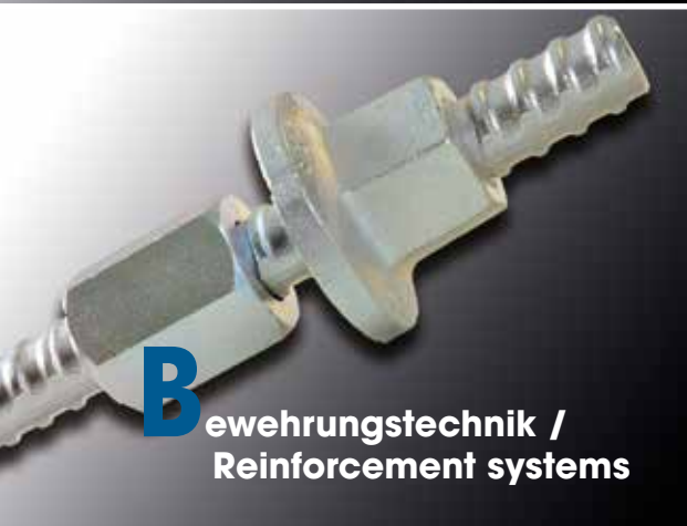
B ewehrungstechnik / Reinforcement systems