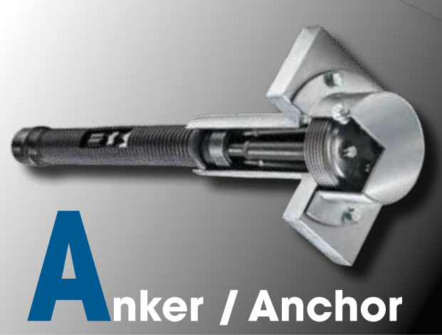
A nker / Anchor