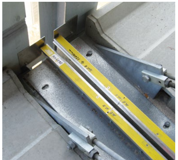
Parkhaus Weiterstadt – FP 90