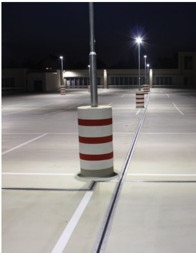
Parkdeck Einkaufszentrum Dresden, Löbtau