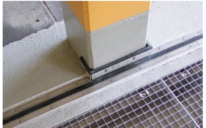
Parkhaus Annaberg – FP 90