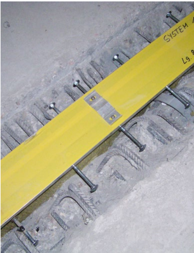
Flughafen Berlin Brandenburg – FP 90 BNI