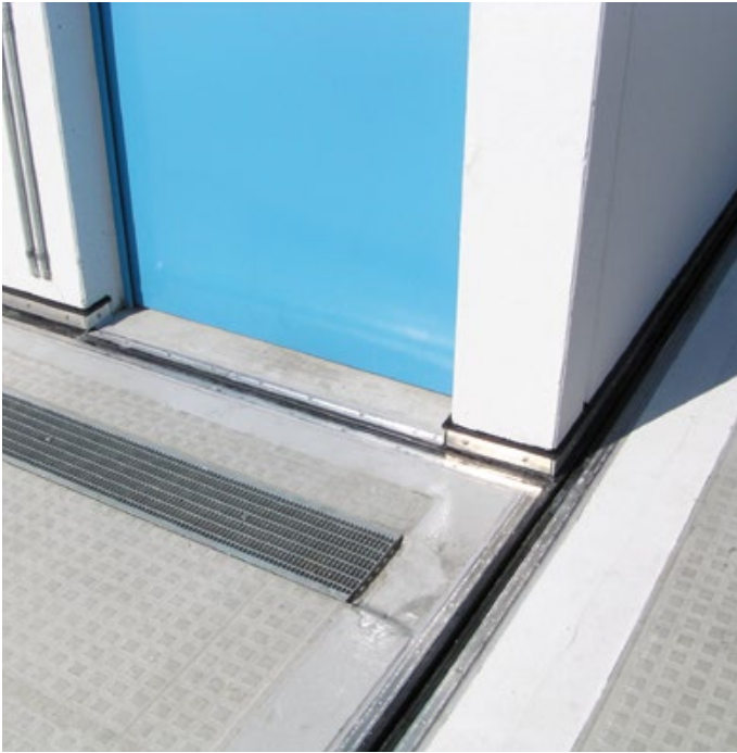
Parkhaus Berlin, Beusselstraße