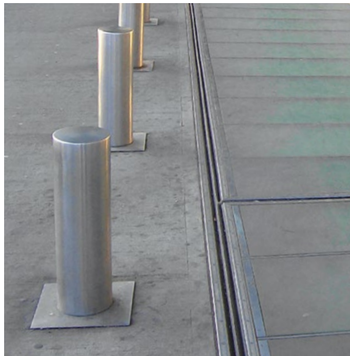
Flughafen Köln/Bonn – FP 90