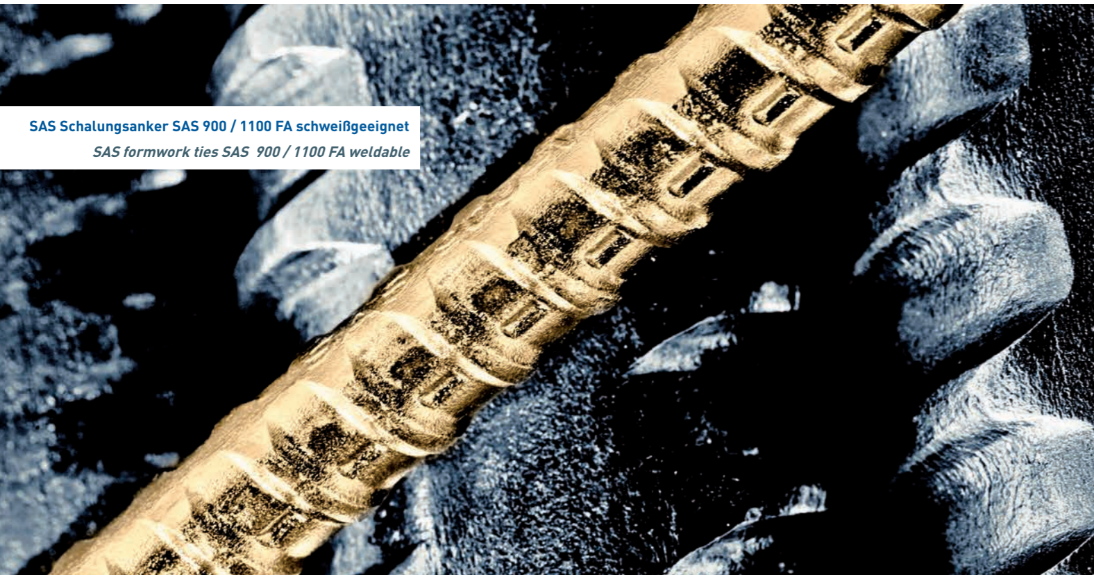
SAS Schalungsanker SAS 900 / 1100 FA schweißgeeignet SAS formwork ties SAS 900 / 1100 FA weldable

SAS formwork ties SAS 900 / 1100 FA weldable